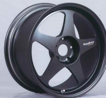
サテン ガンメタル